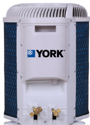
DESCARGA SUPERIOR 9.000 | 12.000 BTU/h